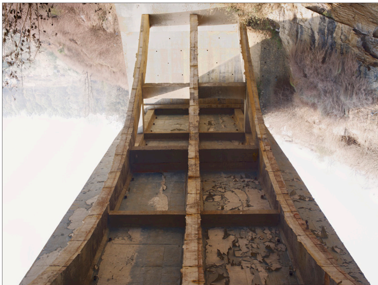
Kathmandu, Tirage digigraphié sur Epson Cold Press Bright, 58 x 70 cm, 2013