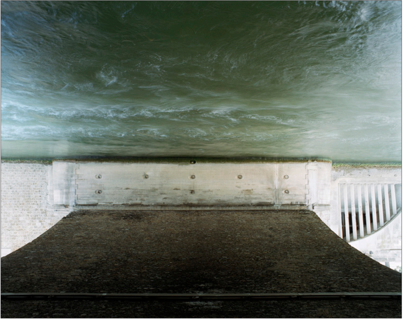
Pont Nuage , Tirage digigraphié sur Cold Press Hahnemühle, 125 x 150 cm, 2011