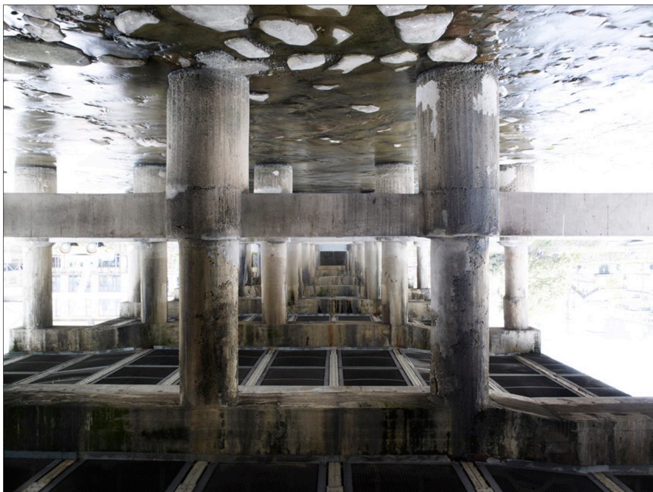
Pont Kyoto 12669, Tirage digigraphié sur Epson Cold Press Bright, 58 x 70 cm, 2013