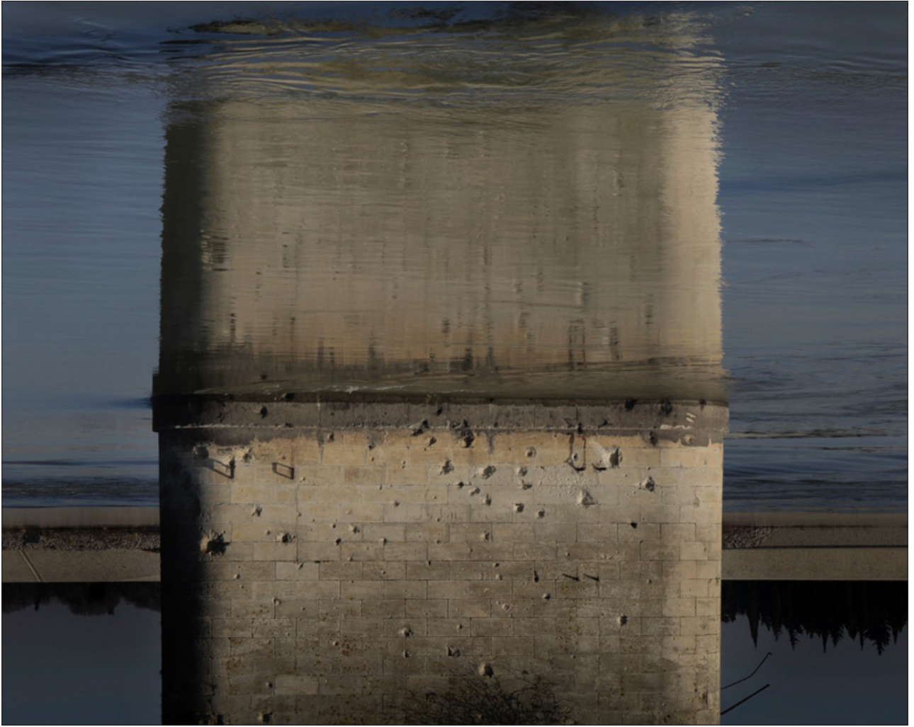
Arles , Tirage digigraphié sur Epson Cold Press Bright, 58 x 70 cm, 2014