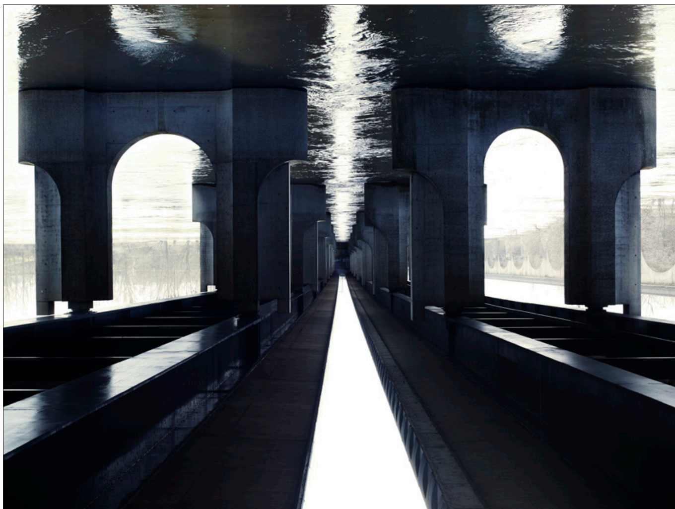
Tours , Tirage digigraphié sur Epson Cold Press Bright, 125 x 150 cm, 2014