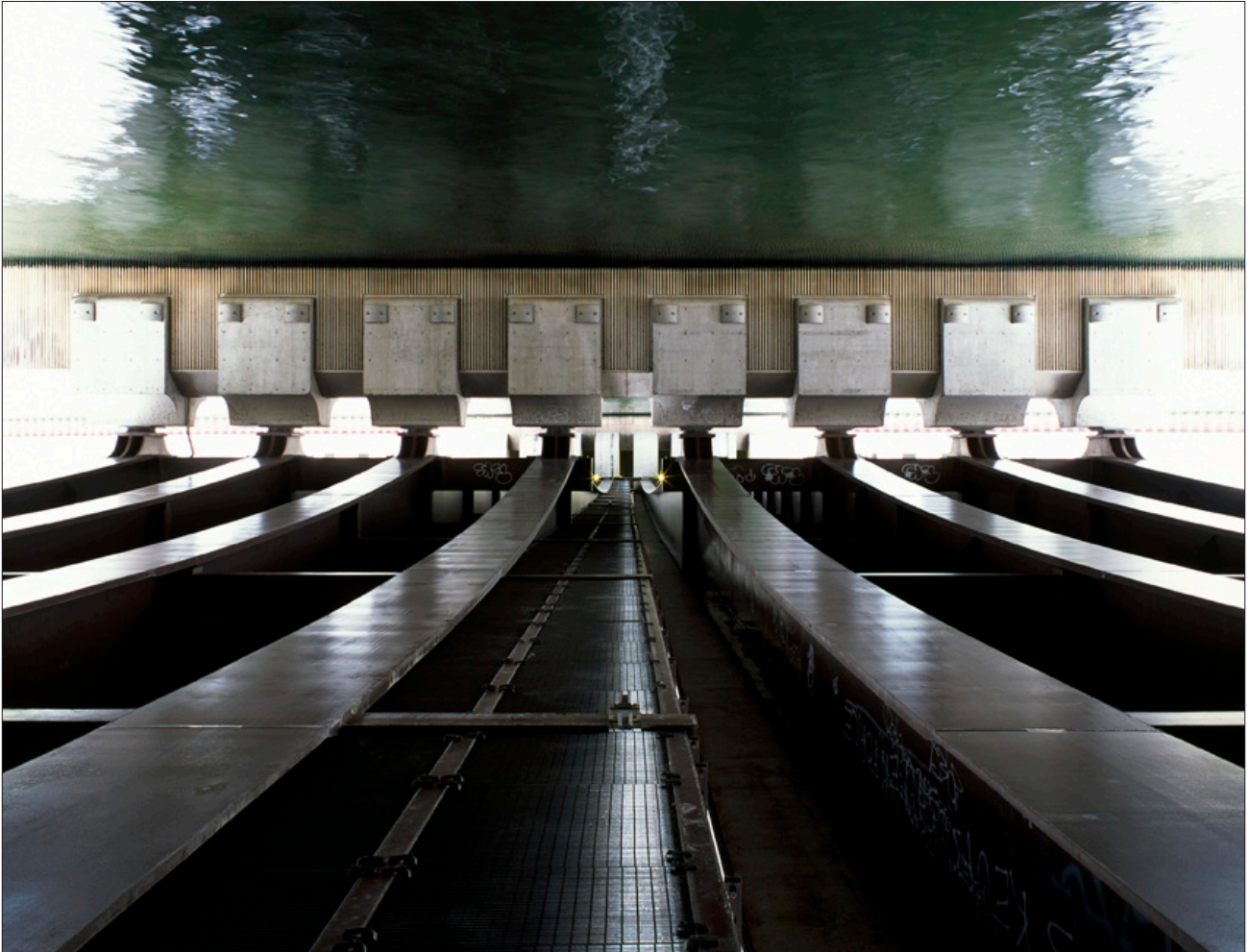
Pont de Billancourt, Tirage digigraphié sur Epson Cold Press Bright, 125 x 150 cm, 2011