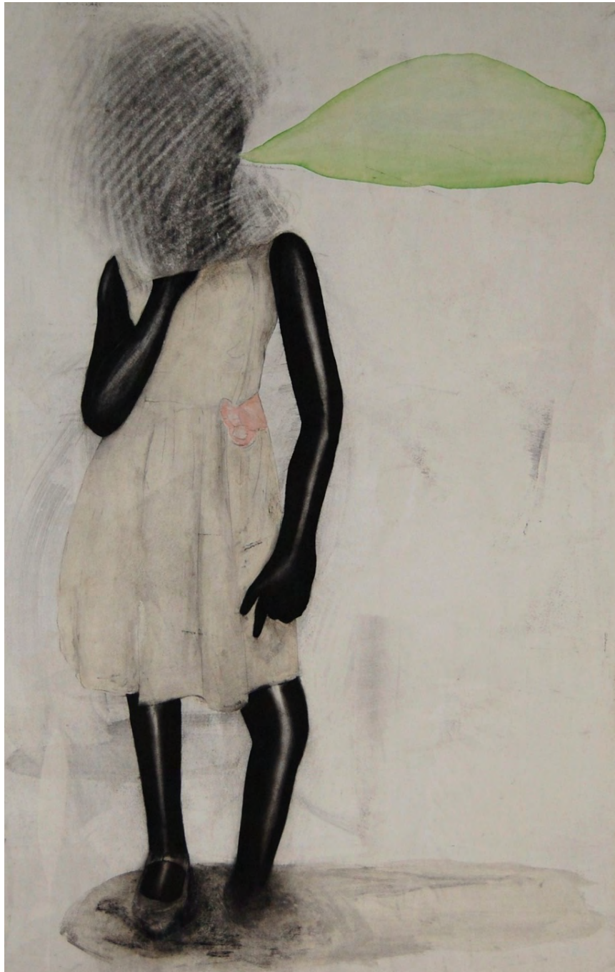
Sans titre , série Les disparitions , fusain, encre de couleur et vernis sur papier, 120 x 80 cm, 2008