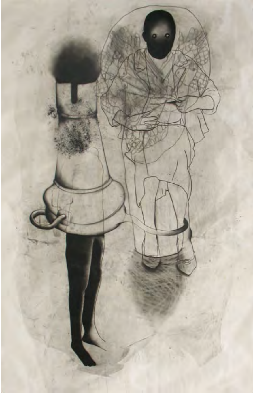
Sans titre, série La Mécanique du reflet, fusain et vernis sur papier, 100 x 150 cm, 2007