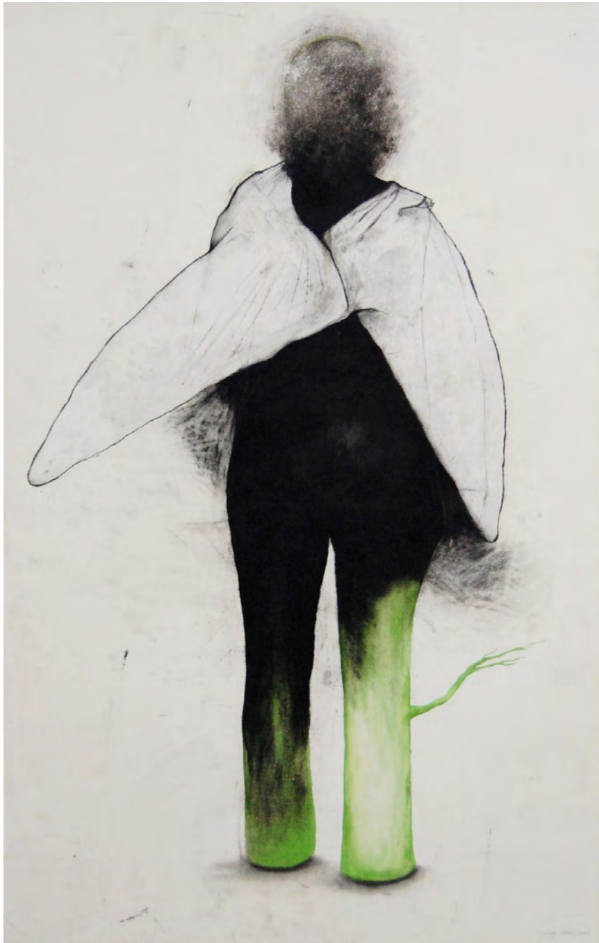
Sans titre , série Les disparitions , fusain, encre de couleur et vernis sur papier, 120 x 80 cm, 2008