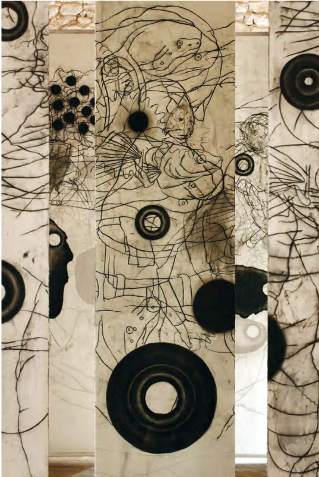
Le grand désordre , fusain et vernis sur papier, 7 kakémonos de 300 x 67 cm, 2008 (détail)