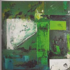
Christiane Chiavazza Composition, 100 x 100 cm