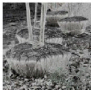
Su-Mei Tse, Photographie couleur, 2010, Edition 5 ex + 1 EA, 80 x 80 cm 10 170 euros.

Financée grâce au soutien de 120 adhérents, cette structure a joué en 10 ans un rôle d'incubateur, complémentaire des institutions existantes, en exposant ces artistes. Les collectionneurs, mais aussi certains établissements comme la Caisse des dépôts et consignation ou le musée national de la Marine ont profité des accrochages pour acheter des œuvres. « Les galeries classiques ne peuvent consacrer leurs espaces à des expositions d'artistes totalement émergents. Pratiquement à chaque exposition de Premier Regard, les artistes ont vendu la quasi totalité des œuvres. L'association ne perçoit aucune commission. Les artistes n'ont pour obligation que de lui laisser une œuvre, indique Henri Jobbé-Duval, maître d'œuvre de l'exposition commémorative. C'est un tremplin, et une occasion pour les artistes de se contraindre à une action professionnelle, de soumettre un vrai projet et de prendre leur carrière en mains. C'est un moment d'apprentissage. Pour certains, cela a contribué à trouver un atelier. » Grâce à un partenariat privilégié avec Henry-Claude Cousseau, directeur sortant de l'École nationale supérieure des beaux-arts (Ensba), de nombreux étudiants de l'établissement y ont fait leurs gammes. L'artiste d'origine luxembourgeoise Su-Mei Tse, qui a représenté son pays à la Biennale de Venise en 2003, y avait fait sa première exposition trois ans auparavant.